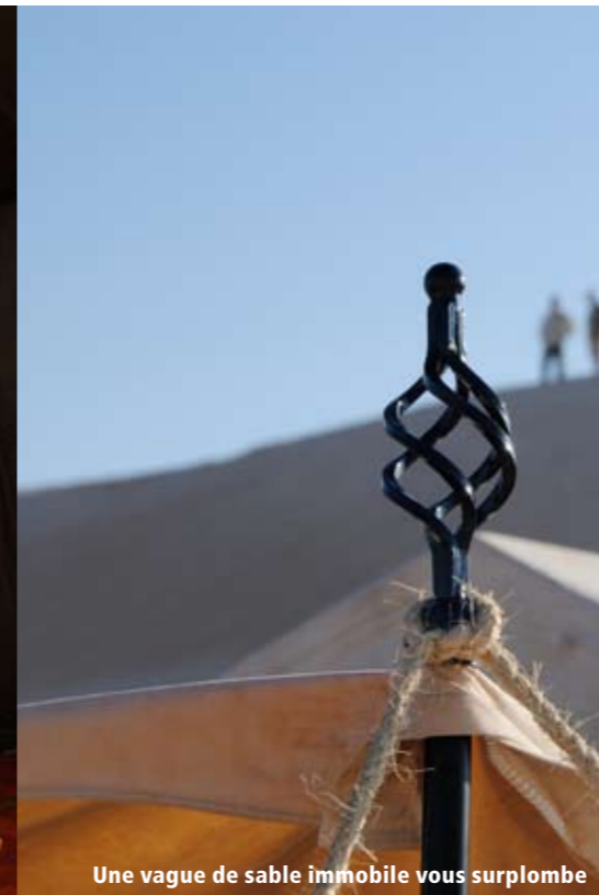
Une vague de sable immobile vous surplombe

Après le Lodge éphémère, prix 2008 de l'innovation, Croisièrejaune décide de lancer un nouveau produit d'un raffinement et d'un confort extrême : «le Lodge Ambassadeur». Ce tout nouveau Lodge Ambassadeur est un projet Croisière jaune, développé avec l'aide d'une décoratrice d'intérieur franco-tunisienne, dans la plus pure tradition des expéditions du début du siècle. Les mots d'ordre ont été «souci du détail, raffinement et confort».