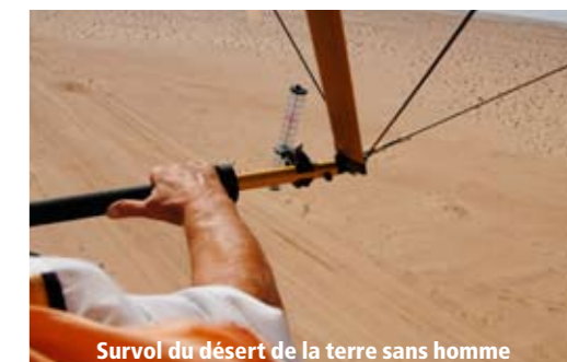
Survol du désert de la terre sans homme

Plus qu'un énième séjour en Tunisie, cette aventure humaine vous présentera cette destination sous un jour nouveau, bien loin des idées reçues... ■