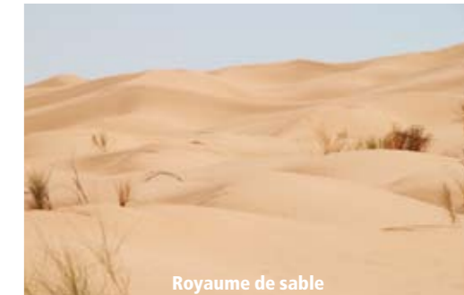
Royaume de sable

Pour prendre pleinement conscience du lieu, après la décontraction, viendra, depuis le ciel, la