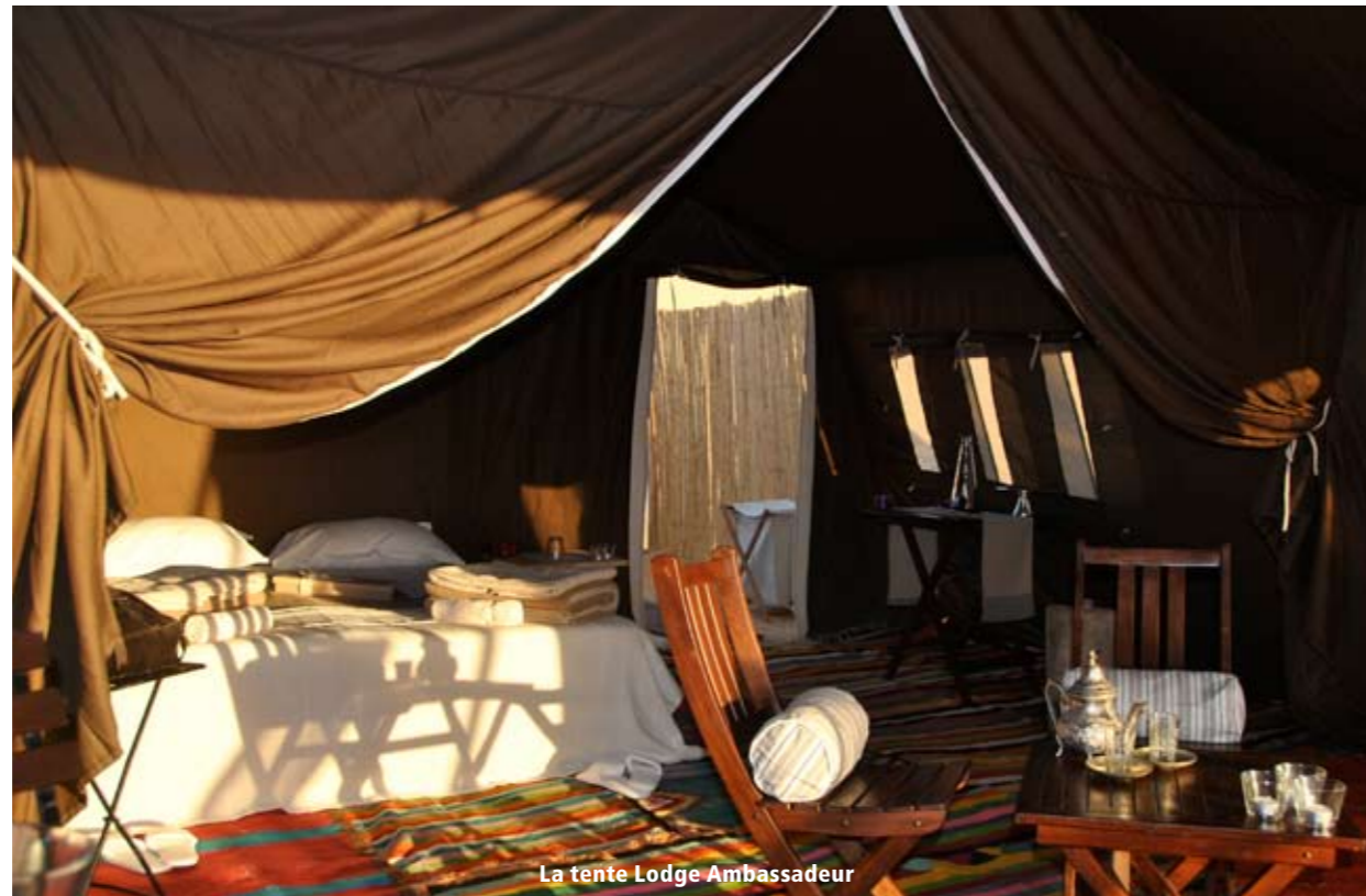
La tente Lodge Ambassadeur